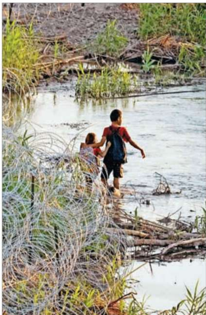
▲ Dos pequeños migrantes intentan cruzar el río Bravo cerca de Eagle Pass, Texas. Un policía del Departamento de Seguridad Pública de ese estado difundió, mediante correo electrónico,