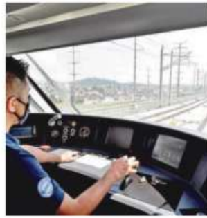
SR DE INFRAESTRUCTURA

El Río Tacubaya, que es parte de un Área de Valor Ambiental en Chapultepec, será saneado y rehabilitado