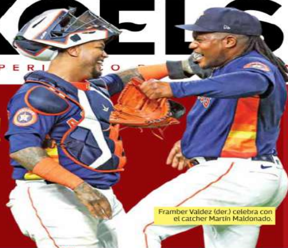
Framber Valdez (der.) celebra con el catcher Martín Maldonado.