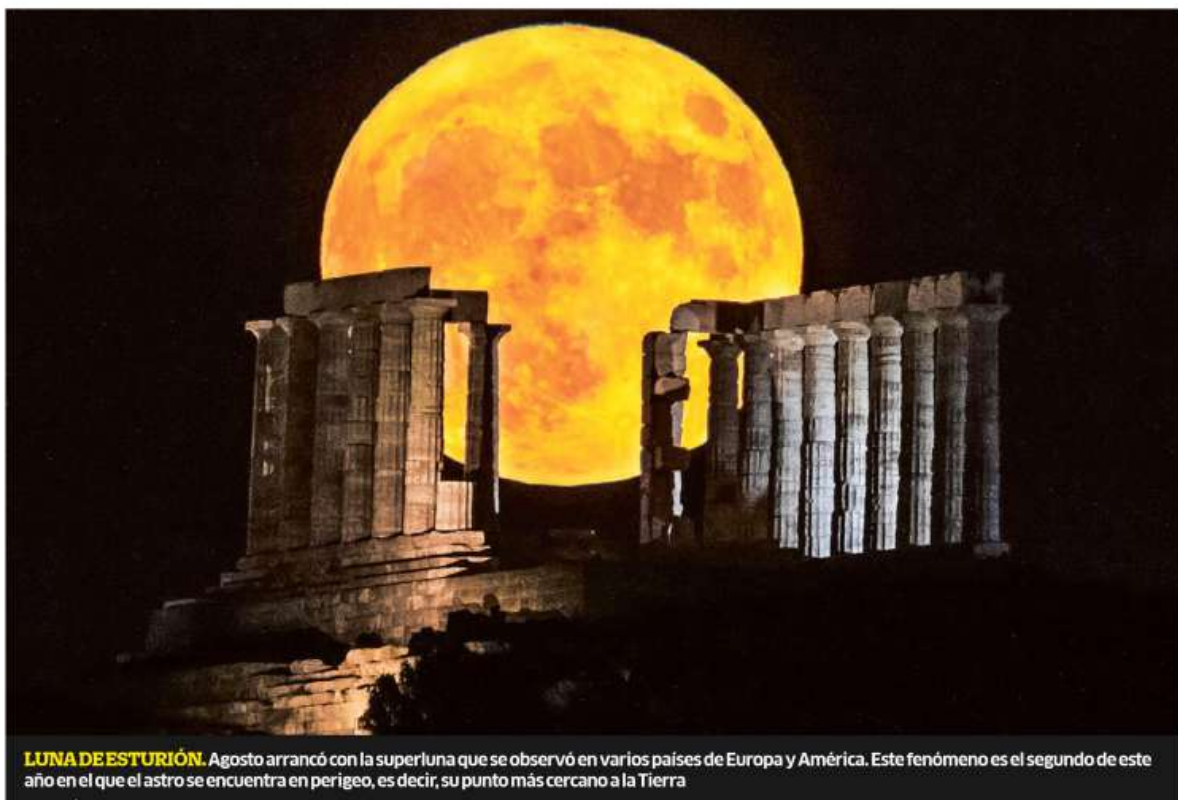
LUNA DE ESTURIÓN. Agosto arrancó con la superluna que se observó en varios países de Europa y América. Este fenómeno es el segundo de este año en el que el astro se encuentra en perigeo, es decir, su punto más cercano a la Tierra