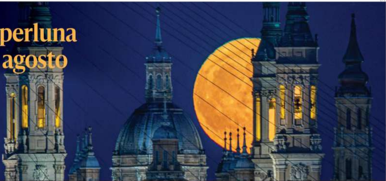
Vista de la primera superluna de agosto emergiendo sobre la Basílica del Pilar, en Zaragoza, España. Se le conoce como "Luna de Esturión", por la época del año en que este pez gigante abunda en la región de los grandes lagos, en la frontera entre Estados Unidos y Canadá.