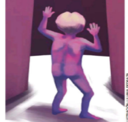
ILUSTRACIÓN: LILIANA FERRAZ