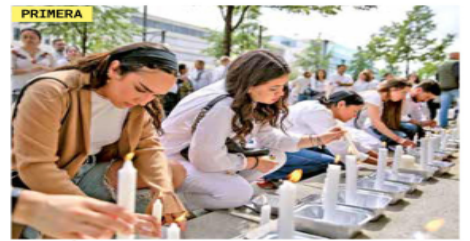
POLICÍA INDAGA DECESO DE MEXICANA

De los aspirantes presidenciales actuales, el único que ha sido destapado en el extranjero es Verástegui, a quien el republicano Donald Trump presentó como prospecto durante un evento en Estados Unidos, el pasado 20 de julio. PRIMERA | PÁGINA 4