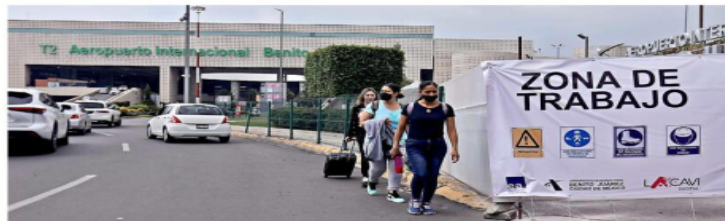
Los trabajos en la Terminal 2 del aeropuerto capitalino ya están en marcha.

Los contratos fueron adjudicados el 23 de mayo a Alfa Proveedores y Contratistas (Apycsa), Cemex Concretos y Jaguar Ingenieros y Constructores, que se comprometieron a entregar las obras el 7 de septiembre, es decir, en menos de cuatro meses.