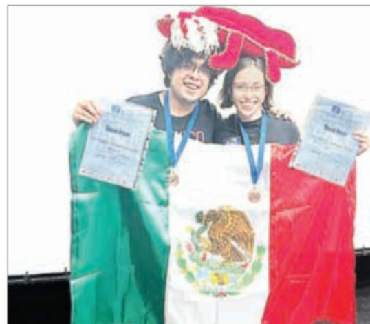
▲ Los jóvenes son estudiantes de las facultades de Ingeniería y

● Es la olimpiada más importante del orbe a nivel universitario en la materia