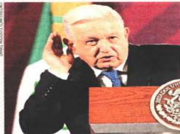
DAVID AGUIRRE/EL UNIVERSAL