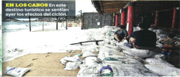
EN LOS CABOS En este destino turístico se sentían ayer los efectos del ciclón.