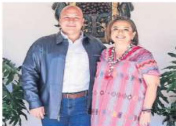
El gobernador Alfaro recibió a la aspirante presidencial del Frente Amplio Xóchitl Gálvez.