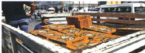
DE LA TORTA A LA PIZZA. Los organizadores del mitin de Adán Augusto en Tuxtla Gutiérrez, Chiapas, llevaron pizzas, jugos, refrescos, playeras, gorras y banderitas.

consultar a los firmantes. "Al más puro estilo de la vieja política, se publicó un desplegado con sus firmas sin haberlos enterado del contenido del mismo. "A ellos, y a quienes están siendo objeto de chantajes y amenazas para esta y futuras acciones, les pido que no se mortifiquen: cuentan con MC".