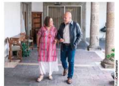
XÓCHITL Gálvez, ayer, con el gobernador de Jalisco, Enrique Alfaro.

Calcula Anpec gasto promedio en útiles de $1,600; padres reportan $2,730; abarrotan familias el Centro para conseguir mejores precios; ladrones hacen su agosto en tumultos págs. 14 y 17