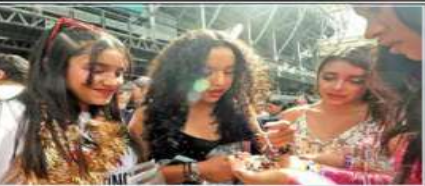
Previo a entrar al Foro Sol, los swifties intercambiaron brazaletes de la amistad. El concierto duró 3.5 horas.