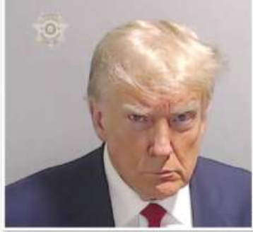
IMAGEN del magnate al ser fichado en la prisión de Fulton, ayer.

INSISTE , al abandonar la prisión, que le robaron la elección y lo probará; antes de él ya enfrentaron ese proceso 11 de 18 coacusados. pág. 22