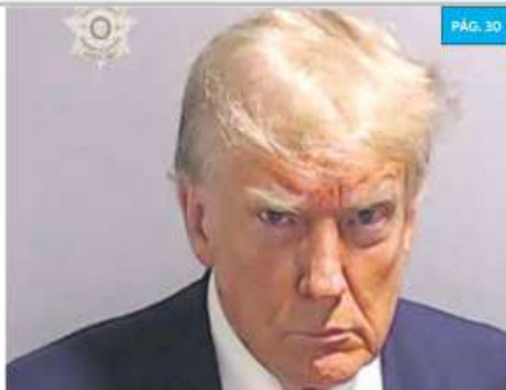
FOTO PARA FICHA CRIMINAL. Por primera vez en EU, un expresidente es fichado con todo y foto policial. Donald Trump fue vinculado a proceso por 13 acusaciones. Pagó una fianza de 200 mil dólares. Iniciaría juicio el 23 de octubre.