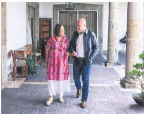
Casa Jalisco. La senadora fue a visitarlo antes del foro del Frente.