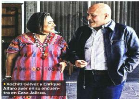
■ Xóchitl Gálvez y Enrique Alfaro ayer en su encuentro en Caso Jalisco.