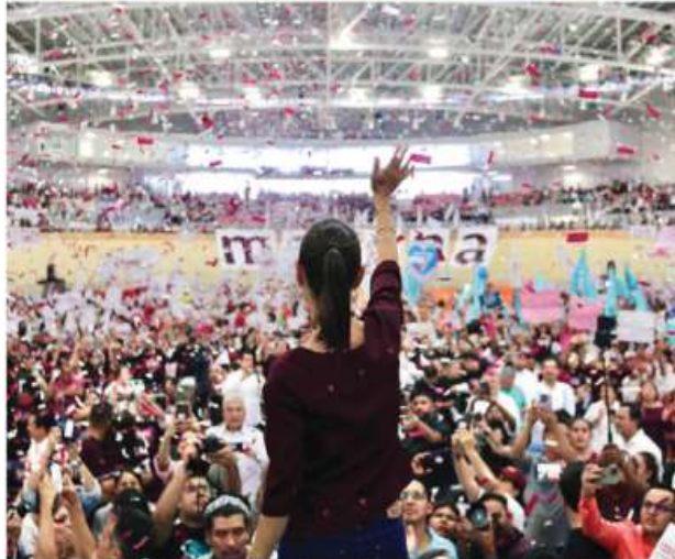
CLAUDIA SHEINBAUM cerró sus recorridos en Xalapa, Veracruz, ayer.

EQUIPOS , con dudas sobre ejecución del sondeo principal; irán encuestados en células de al menos 7 personas; van por 12,500 cuestionarios.