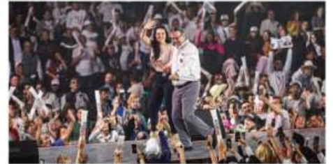
MARCELO EBRARD estuvo en la Arena Ciudad de México, ayer.