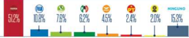
GRÁFICO: ALEJANDRO OYERVIDES

NUEVA ERA / AÑO. 7 / NO. 2268 / LUNES 28 DE AGOSTO DE 2023