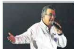
MARCELO EBRARD CIERRA EN LA CAPITAL; EN LA ARENA CIUDAD DE MÉXICO PIDE PENSAR EN EL FUTURO. PÁG. 34