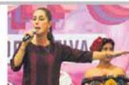
CLAUDIA SHEINBAUM CONCLUYE EN VERACRUZ ASAMBLEAS INFORMATIVAS Y SE PROCLAMA GANADORA. PÁG. 35