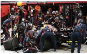
EL TAPATÍO, en la carrera del GP de Holanda.

Segundos tardó el cambio de llantas de Pérez en los pits