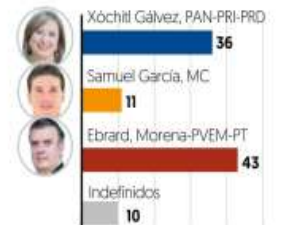
Fuente: El Financiero, encuesta telefónica nacional realizada a 500 adultos el 25-26 de agosto de 2023.