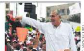
ADÁN AUGUSTO LÓPEZ PIDE NO CAER EN AMBICIONES PERSONALES Y QUE LO DEJEN ENCABEZAR LA CONTINUIDAD. PÁG. 35

XÓCHITL GÁLVEZ. DEFIENDE A MC; 'NO ESTÁ HACIENDO EL JUEGO DE AMLO', SÓLO TOMA SU TIEMPO. PÁG. 36