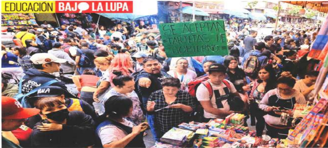
A un día del regreso a clases, cientos de padres de familia recorrieron Mesones y Pino Suárez en busca de los últimos útiles escolares para sus hijos.