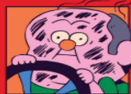
Ilustración: Constanza Planeta

El libro Podría ser peor reúne 50 historias sobre errores épicos y hechos absurdos que ayudan a animar a los desencantados. / 18