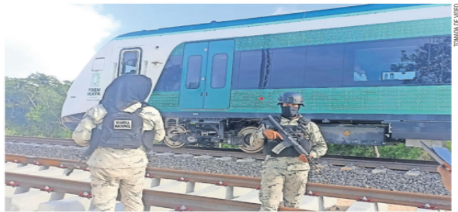
Militares custodiaron el vagón durante el tiempo que estuvo detenido. En tanto, funcionarios y directivos de empresas constructoras trataron de ayudar a que el tren retomara su curso.

Con AMLO a bordo, se descompone el Tren Maya