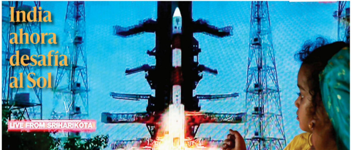
El gobierno de India lanzó con éxito su primera misión espacial destinada al estudio del Sol, un desafío que supone un nuevo logro para el programa espacial del país asiático (luego de llegar hace unos días al lado oscuro de la Luna). En la foto, una pequeña observa la transmisión del despegue.