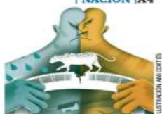
ILLUSTRACIÓN: ANTONIO LÓPEZ

La ruta incluye 28 localidades con amenazas por ciclones tropicales, altas temperaturas, sequía e inundaciones que se agudizan con el calentamiento global. El estado con más focos rojos es Yucatán. | NACIÓN | A4