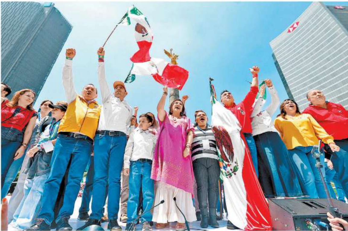
La senadora, flanqueada por Zambrano, Cortés y Moreno, líderes nacionales de PRD, PAN y PRI, en el Ángel. JAVIER RÍOS

Proyecto de Ríos-Farjat Liberar a mujeres juzgadas por aborto, piden en la Corte RUBÉN MOSSO - PAG. 15