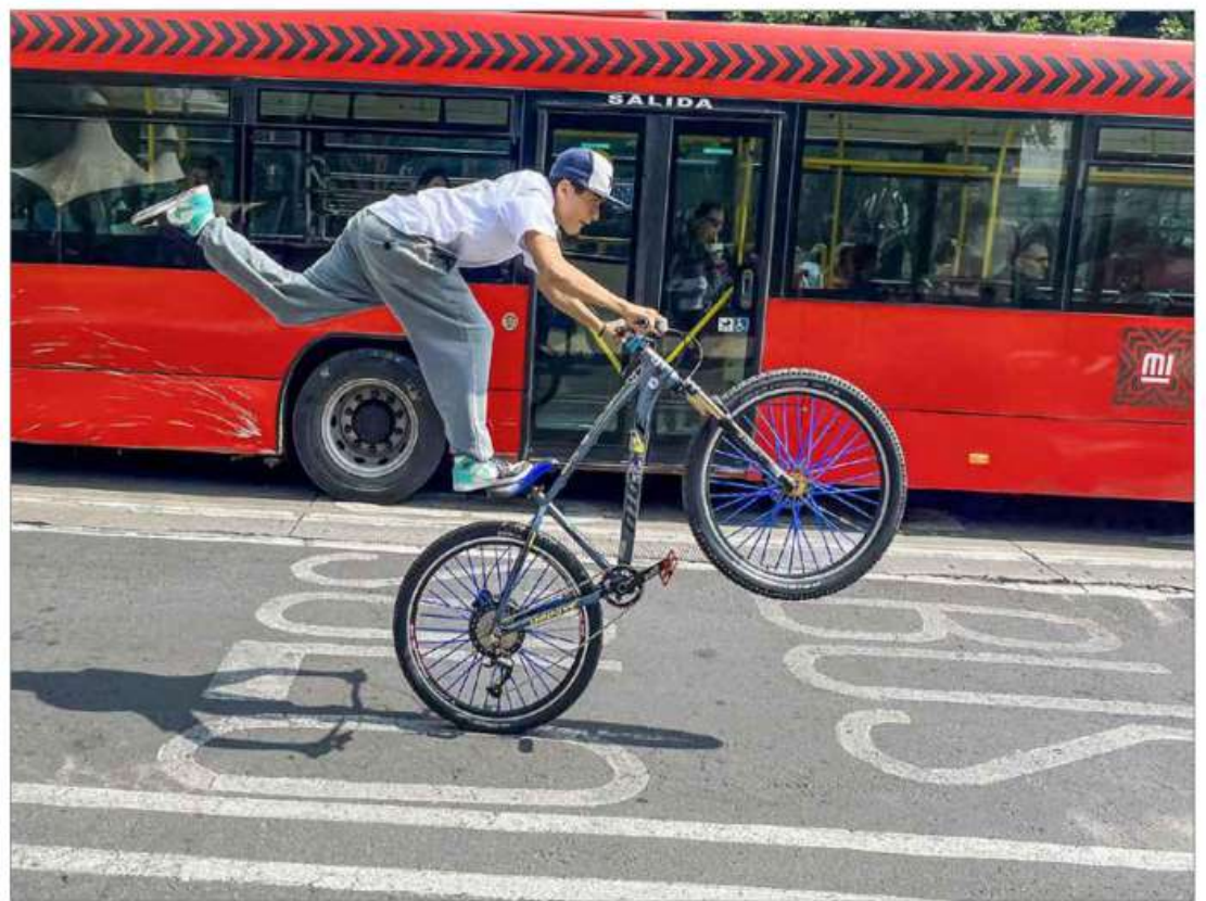
▲ Integrante de la agrupación de ciclistas Tribu Stun realiza acrobacias en las inmediaciones del Metro Hidalgo.