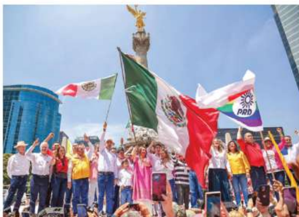
XÓCHITL Gálvez se convirtió de manera oficial en la representante del Frente Amplio por México, estuvo acompañada por las dirigencias del PRI, PAN y PRD.

En gira por Quintana Roo, el Presidente afirma que opositores no van a volver; “no hay nada que temer, ya este pueblo se echó a andar... esto es otra realidad”