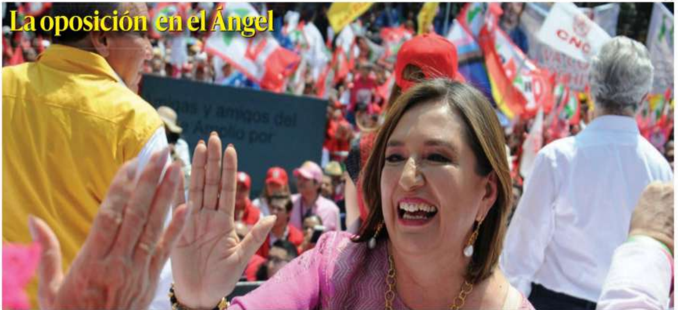
La esperanza está ahora en otras manos, comentó la senadora Xóchitl Gálvez en el evento público destinado a festejar que es ya, con constancia en la mano, quien aglutinará a los principales partidos de oposición en el 2024. Pag 6 y 7