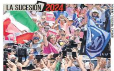
Cientos de personas arrojaron ayer a la senadora.

Asimismo, la compra de tabaco creció 3 mil 778 millones de pesos a pesar de prohibiciones y restricciones a fumadores. | NACIÓN | A8