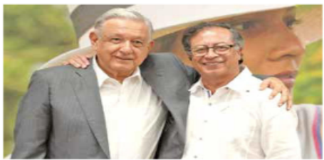
El Presidente de México se reunió ayer con su homólogo colombiano en la ciudad de Cali, en el inicio de su gira por Sudamérica.

ADRENALINA UNA CITA CON LA HISTORIA El serbio Novak Djokovic disputará mañana su décima final del US Open. Su rival será el ruso Daniil Medvedev.