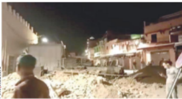
DAÑOS en Marrakech, ayer.

MOVIMIENTO de 6.8, el más severo en ese país, colapsa estructuras; registran 153 heridos; inicia rescate de personas atrapadas. pág. 13