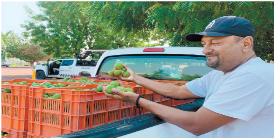
El corte de limón se reactivó ayer en Apatzingán y esperan que el sector se recupere pronto, luego de cuatro semanas sin actividad.

Tras casi un mes de parálisis retoman el corte y distribución del cítrico; productores reconocen que siguen obligados a pagar las extorsiones