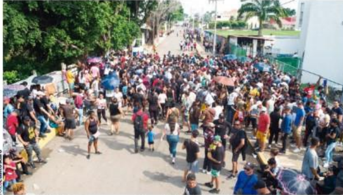
INDOCUMENTADOS protestan afuera de las oficinas migratorias de Tapachula, ayer.