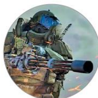
Call of Duty