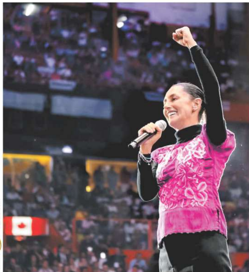
La aspirante presidencial pidió a los competidores cerrar filas por la transformación. ESPECIAL

"Nos encontramos en la libertad": Hadassah Modelo mexicana trans