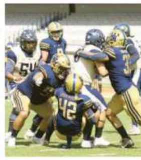
PUMAS CU PBA