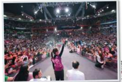
CLAUDIA Sheinbaum, ayer en la Arena México.

A 16 DÍAS del paso de Otis, autoridades buscan bajo deslave a una familia en la Nueva Era, ayer.