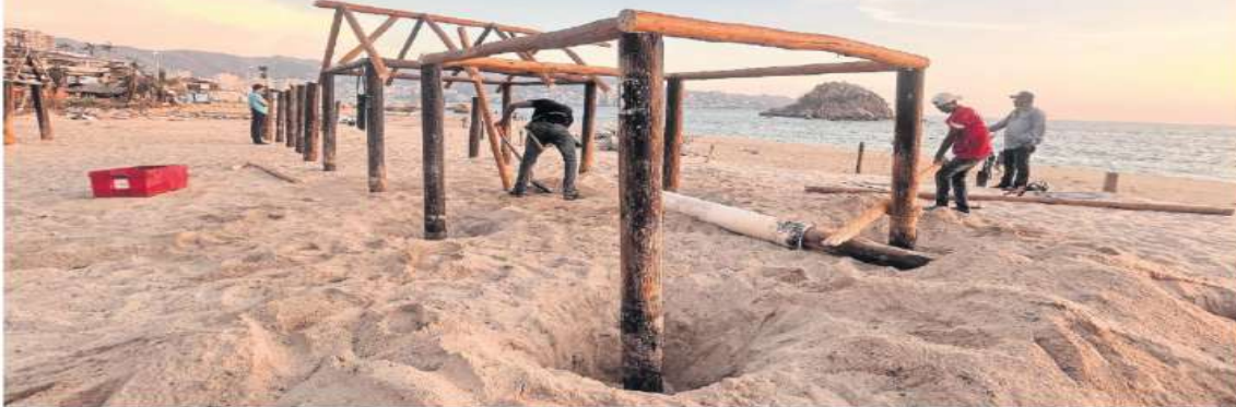
DEVASTADOR HURACÁN OTIS

Acapulco.— A más de dos semanas del paso del huracán, trabajadores se esmeran en colocar las palapas y levantar su ciudad. Confían en que antes de fin de año el sector turístico se reactive. | ESTADOS | A12