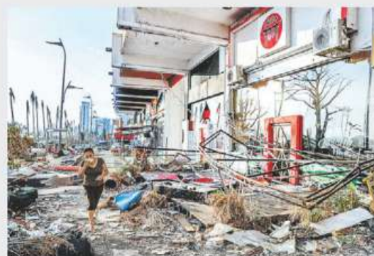
El gobierno declaró fin de la emergencia.