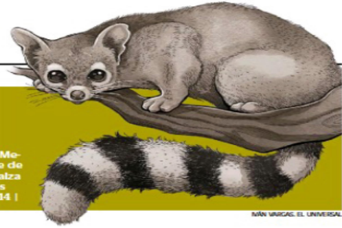
ILUSTRACIÓN: MÓN VARGAS