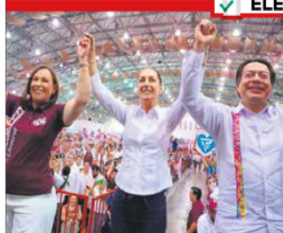
Tiempo de mujeres. Sheinbaum dijo que estará a la altura de las circunstancias y dará continuidad.