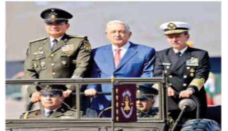
El presidente López Obrador (centro), acompañado de los titulares de Sedena, Luis Crescencio Sandoval, y Semar, Rafael Ojeda.

En el documento publicado en el Diario Oficial de