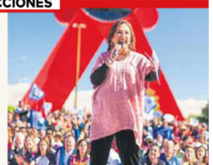
'Me sobra carácter'. Gálvez promete poner fin a la violencia contra las mujeres.