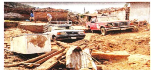
Calles, viviendas y vehículo en Coyuca de Benítez muestran que la situación de emergencia permanece.

Explicó que el sobrecosto del AIFA está dentro de los parámetros permitidos, debido a que ya contaba con algunos derechos de vía y terrenos, pero con el Tren Maya, debido a costos de transacción que han impedido el inicio o avance de la obra, se ha encarecido su construcción.