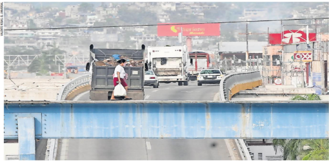
Los ciudadanos arriesgan la vida al cruzar un puente peatonal en el bulevar Vicente Guerrero, que se quedó sin barandal y no ha sido reparado.

La huella del huracán aún está presente en Acapulco, al igual que el temor a las lluvias; comercios y escuelas permanecen cerrados y la gente critica la omisión de autoridades