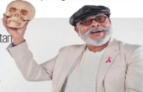
JUAN BOTES, EL UNIVERSAL