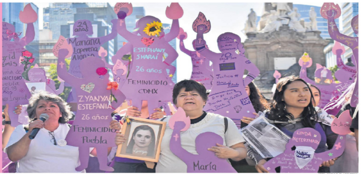
ABRIL ANGUILO, EL UNIVERSAL