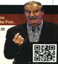
PIPIAS DE FOX

SEPTIEMBRE 26. "La verdad única es que no hay moreno o morena que no esté totalmente sucio".