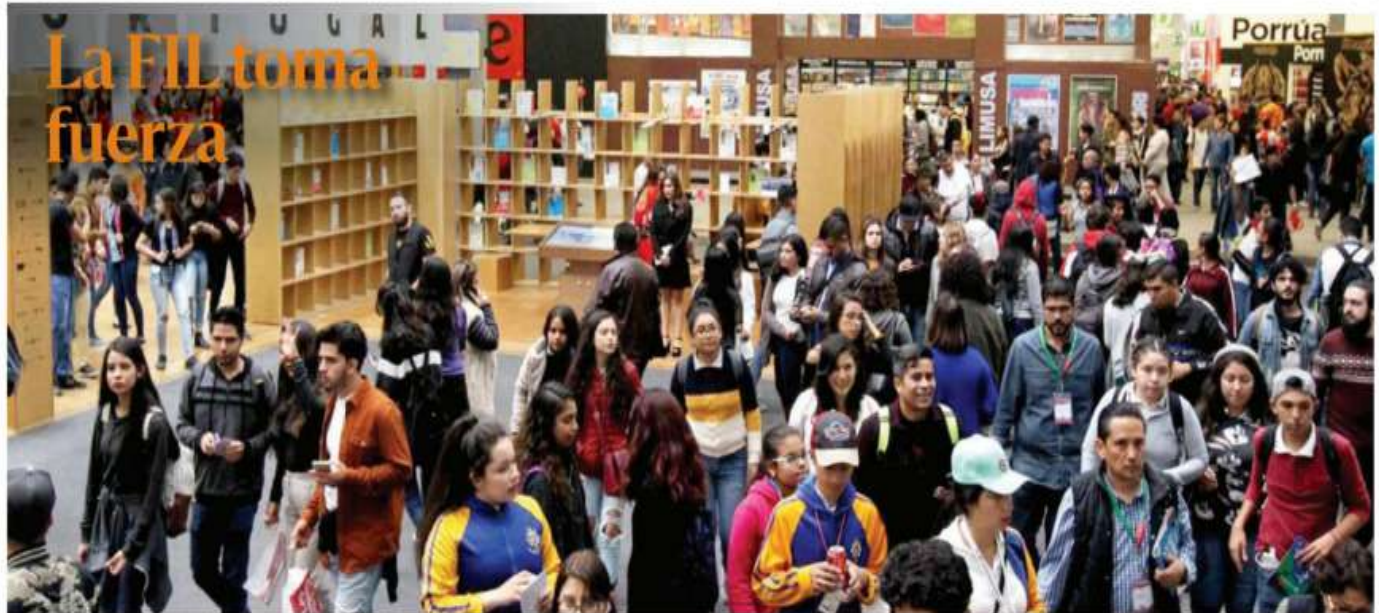
A tres días de la inauguración de la Feria Internacional del Libro (FIL) 2023, miles de asistentes buscan las novedades y ofertas editoriales en español y otros idiomas; asisten a presentaciones de libros y a diversas actividades, conferencias y talleres. PÁGS 19-20