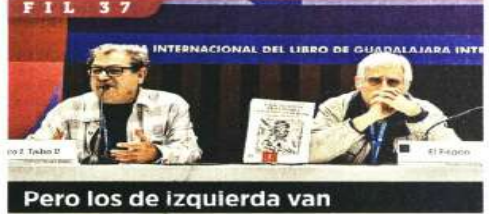
PERO LOS DE IZQUIERDA VAN

Dijo que él ha rechazado varias invitaciones a la FIL y se refirió también a la decisión de la precandidata presidencial de Morena, Claudia Sheinbaum, de tampoco asistir al encuentro librero.