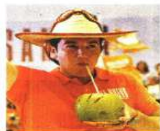
■ Samuel García ayer estuvo de gira por Colima.

"Claudio X. González, usted dijo que iba a luchar contra la corrupción, con pruebas y hablando con la verdad. Pero hoy, con tal de desprestigiarlo, publicó un audio