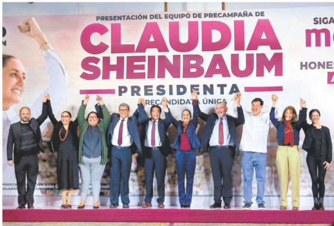
La ex jefa de Gobierno incluyó entre sus colaboradores en esta etapa a Monreal, Adán Augusto y Fernández Noroña. ARACELI LÓPEZ