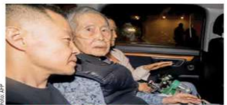
PURGÓ 16 DE LOS 25 AÑOS DE SU CONDENA.