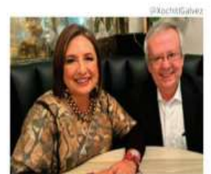
Xóchitl y Urzúa, en foto de archivo.

Solidez. La precandidata presidencial del Frente Amplio por México, Xóchitl Gálvez, presentó el segundo bloque de su equipo rumbo al 2024 en el que destaca el ex secretario de Hacienda de la 4T, Carlos Urzúa, a cargo del rubro Finanzas Públicas. José Ángel Gurriá entregó el Plan de Gobierno de la Coalición opositora. PAG 8