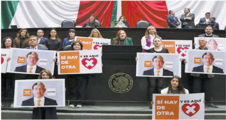
En la Cámara de Diputados, panistas sacaron carteles con los rostros unidos de Andrés Manuel López Obrador y Samuel García.

Dante da por terminada relación con PRI y PAN; ruptura abre la puerta a Morena para sumar otro aliado y sacar iniciativas y nombramientos