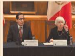
Janet Yellen está en México.

El tráfico de drogas socava el estado de Derecho y plantea riesgos para nuestra seguridad.