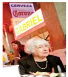
Yellen comió en una taquería en la colonia Cuauhtémoc.

El gobierno de México afirmó que el flujo de finanzas ilícitas en América del Norte no conoce límites geográficos, por lo que sus acciones contra este delito se benefician de la colaboración con Estados Unidos. En un mensaje, el secretario de Hacienda, Rogelio Ramírez de la O, y Janet Yellen, secretaria del Tesoro de EU, coincidieron en solicitar mayor cooperación de bancos y empresas para frenar el lavado de dinero. "La sincronización de nuestros esfuerzos es fundamental, sobre todo el intercambio de nuestro gobierno, pero también con