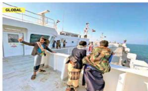
SE TOMAN SELFIES Y PISOTEAN BANDERAS