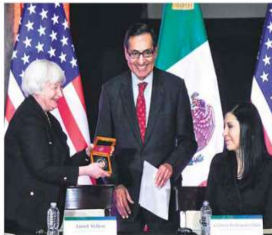
Conmemoración. Lanzan moneda de 20 pesos por 200 años de relación bilateral.

La sólida estabilidad macroeconómica de México y su participación en las cadenas de valor globales y regionales, lo convierten en el aliado lógico de EU en el marco del friendshoring , dijo Janet Yellen. De visita, la secretaria del Tesoro de EU dijo que México está bien posicionado para capitalizar oportunidades de la relocalización. "Pero aprovecharlas requiere que los gobiernos construyan un entorno sólido de inversión y operación para la IP, con estabilidad regulatoria y Estado de derecho". —F. Gascón / PÁG. 4