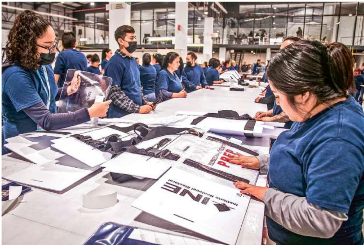
CUENTA REGRESIVA. Arrancó en los Talleres Gráficos de México la producción del material electoral para las elecciones del 2024, donde se renovará la Presidencia, senadurías y diputaciones MÉXICO P. 3