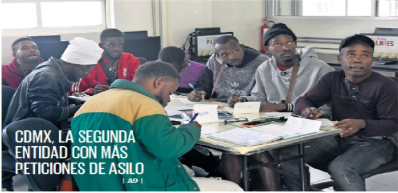
EDUARDO OSTOYA/EL UNIVERSAL

CDMX, LA SEGUNDA ENTIDAD CON MÁS PETICIONES DE ASILO