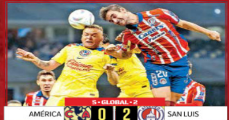
5 - GLOBAL - 2 AMÉRICA 0 2 SAN LUIS

América se dedicó a cuidar la ventaja que sacó en el juego de ida y aunque anoche cayó ante San Luis, logró meterse a la final. / 4 y 5