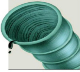
ILUSTRACIÓN: ANY ORTIZ