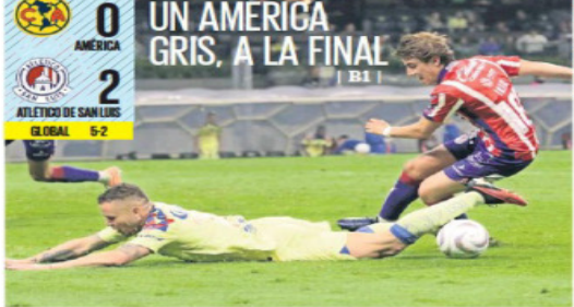
ONEL MEA/EL UNIVERSAL