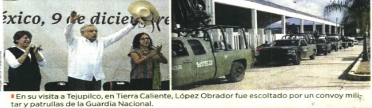
En su visita a Tejupilco, en Tierra Caliente, López Obrador fue escoltado por un convoy militar y patrullas de la Guardia Nacional.