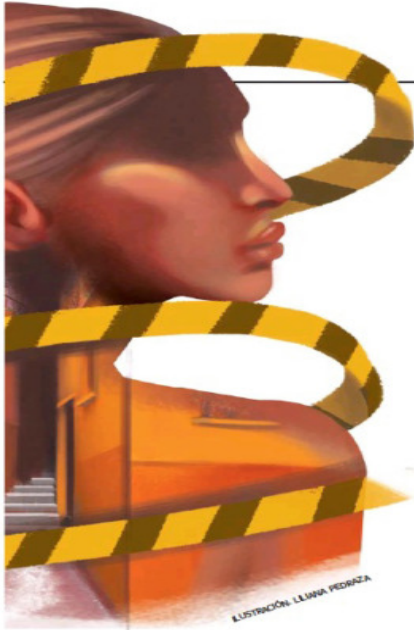
ILUSTRACIÓN: LEYLA PEDRAZA

Guanajuato, el estado más violento para las mujeres