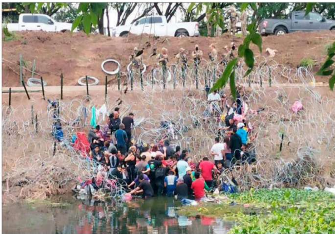
▲ Un centenar de migrantes provenientes de Matamoros, Tamaulipas, entre ellos ancianos, mujeres y niños, atravesó ayer el río Bravo en su intento por solicitar asilo en el país vecino. Una cerca de alambre con navajas impidió el paso, al tiempo que integrantes de la Guardia

Desesperación de extranjeros en la frontera texana