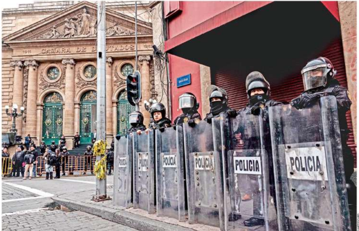
BLINDAJE. Policías capitalinos resguardaron la sede del Congreso local, en Donceles, donde tras más de cinco horas de debate no lograron votar la ratificación de la fiscal Ernestina Godoy, por lo que se quedó en el aire CDMX P. 6