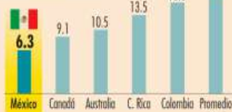
Tasa de contribución en los países de la OCDE en 2022 | %

• Su tasa de cotización es un tercio de la tasa promedio; crecerá a 15%, con la reforma a la Ley del Seguro Social.