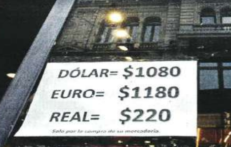
Solo por la compra de su mercadería.