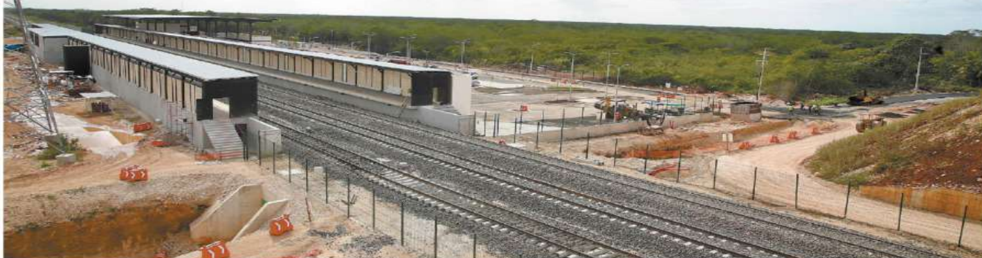
Pobladores y activistas señalan que el presidente López Obrador sólo inaugurará las vías, porque estaciones, como la de Calkiní, todavía no están terminadas.

hecho por EL UNIVERSAL, se constató que hay vías inconclusas y señalética faltante. En las estaciones y vías se carece de infraestructura peatonal, ciclista y de accesos, así como de instalaciones y escaleras eléctricas. | A4 Y A5 |