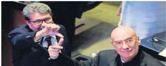
COMUNICACIÓN EL UNIVERSAL

En el Senado, Morena y MC no logran acuerdo para el nombramiento de la ministra de la Corte, por lo que la designación la hará el Presidente de la República, mientras que el Congreso de la Ciudad de México pone pausa a la ratificación de Ernestina Godoy como fiscal. | A8 Y A19 |