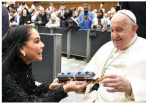
ELPAPA Francisco, con la gobernadora de Quintana Roo, ayer.

ENTREGA gobernadora de Q.Roo al Pontífice carta de AMLO y una réplica del ferrocarril que será inaugurado mañana; realiza gira en Italia para promover turismo en su entidad. pág. 10