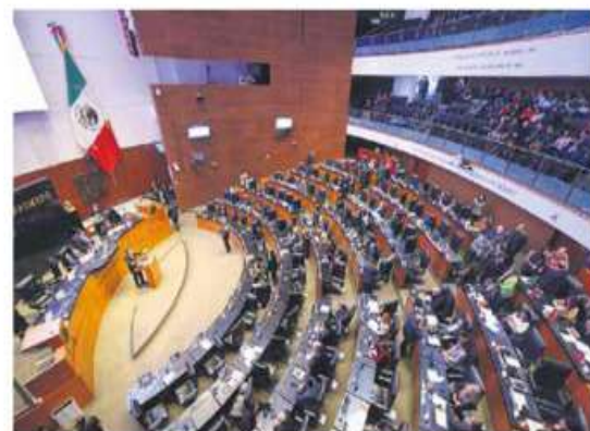
Sin acuerdos. Rechazan la segunda terna para sustituir a Arturo Zaldívar.

su voto al nombramiento de dos magistrados electorales que están pendientes. Tras el rechazo de la segunda terna, ahora —según la Constitución— el presidente deberá designar ministra a alguien de esta terna. —Eduardo Ortega / PÁG. 38