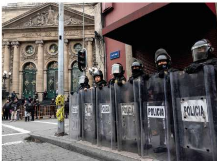
POLICÍA capitalina blindó ayer la Cámara de Diputados local.

Oradores de la 4T hacen tiempo para no llegar a la votación que sería adversa; PAN acusa "machincuepas"; retomarán discusión en periodo extra pág. 16