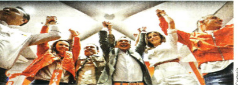
■ Pablo Lemus recibió su constancia como candidato de Movimiento Ciudadano a Gobernador de Jalisco.