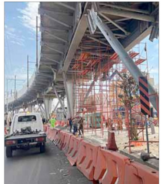
▲ Uno de los tramos de la línea 12 del Metro, en el que ayer se afinaban detalles.