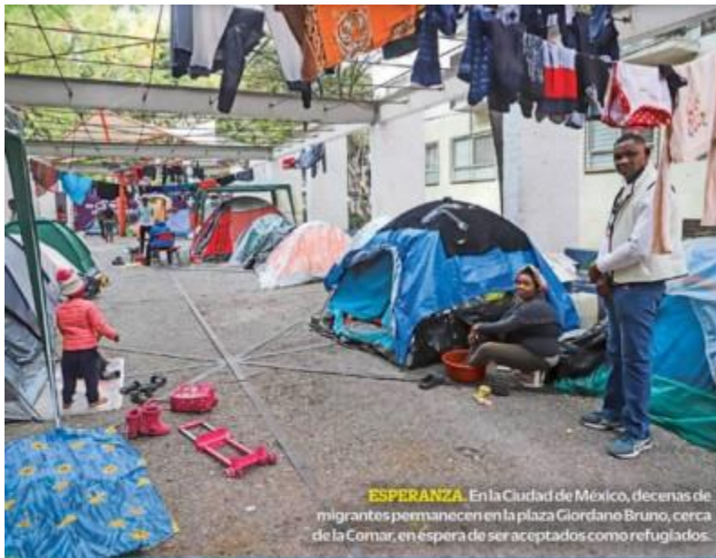
ESPERANZA. En la Ciudad de México, decenas de migrantes permanecen en la plaza Giordano Bruno, cerca de la Comar, en espera de ser aceptados como refugiados.