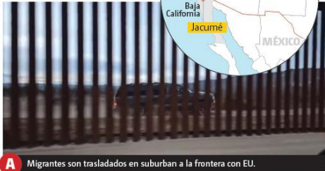
A Migrantes son trasladados en suburban a la frontera con EU.