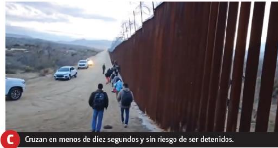
C Cruzan en menos de diez segundos y sin riesgo de ser detenidos.