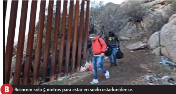
B Recorren solo 5 metros para estar en suelo estadounidense.