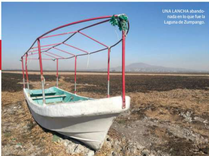
UNA LANCHA abandonada en lo que fue la Laguna de Zumpango.

CONGRESO de CDMX vuelve a dejar en vilo tema del agua; Morena y PAN rompen quorum ; se pediría declarar emergencia.