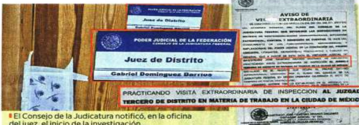
El Consejo de la Judicatura notificó, en la oficina del juez, el inicio de la investigación.

Apenas el miércoles, el INE presentó a representantes de los partidos políticos un protocolo de protección para los candidatos a la Presidencia, a Gobernadores, a diputados federales y locales, que considera equipos de seguridad con elementos y patrullas para resguardar a aspirantes.