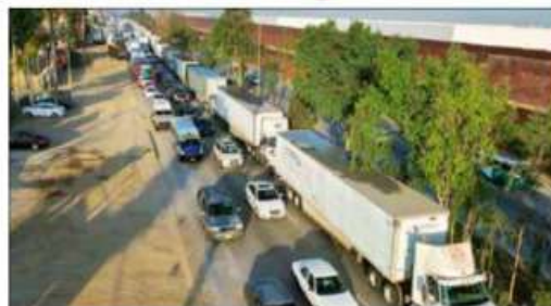
▲ Cientos de transportes quedaron varados por una falla en el sistema de despacho del organismo en la frontera con EU. La imagen, en Tijuana, BC. REDACCIÓN / P 21