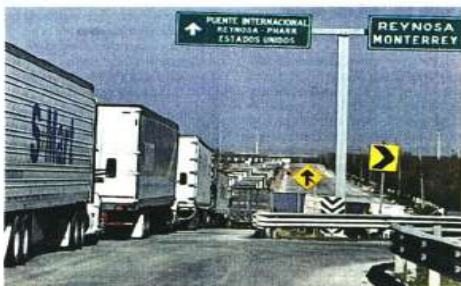
La falla en Aduanas provocó largas filas en los puntos fronterizos.

El SAT, responsable de los sistemas aduanales, informó que las intermitencias se debieron a una "actualización", pero que las actividades ya se habían normalizado. Sin embargo, agentes aduanales que padecieron la detención del flujo de mercancías, nula conexión en enlaces y errores de validación, así como el llenar papeletas a mano, se quejaron de una respuesta confusa y sin la an-