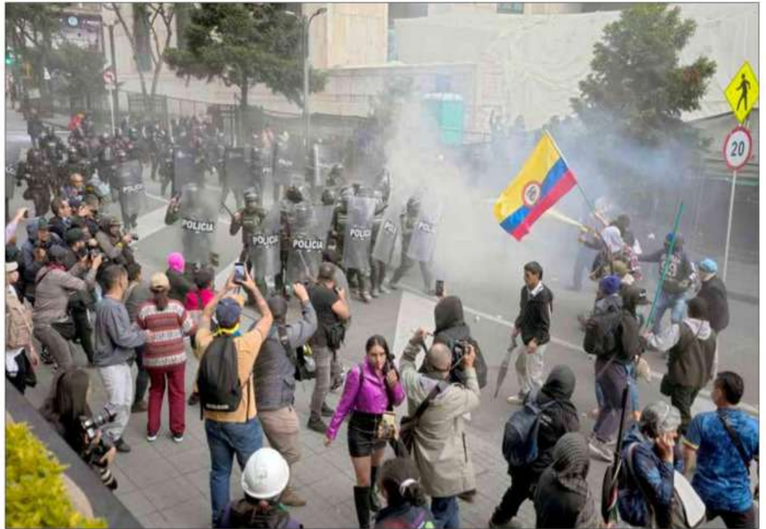
▲ Algunos manifestantes, con la cara cubierta, lanzaron piedras a las fuerzas policíacas, las cuales respondieron con gases lacrimógenos durante las protestas ante la Suprema Corte de Justicia por la parálisis para elegir a quien encabezará la Fiscalía General. EL