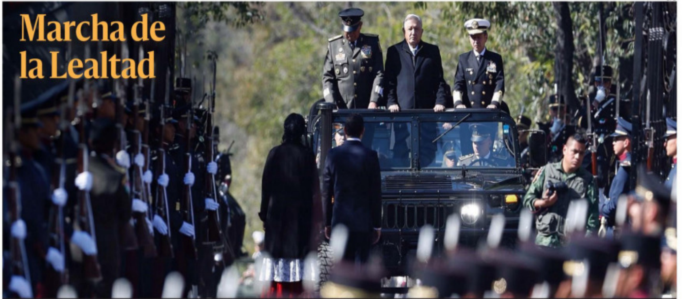
El presidente López Obrador encabezó el 111 aniversario de la Marcha de la Lealtad en el Castillo de Chapultepec, en la que el general Luis Cresencio Sandoval (Sedena) ratificó el compromiso de las Fuerzas Armadas a las instituciones democráticas y a México.