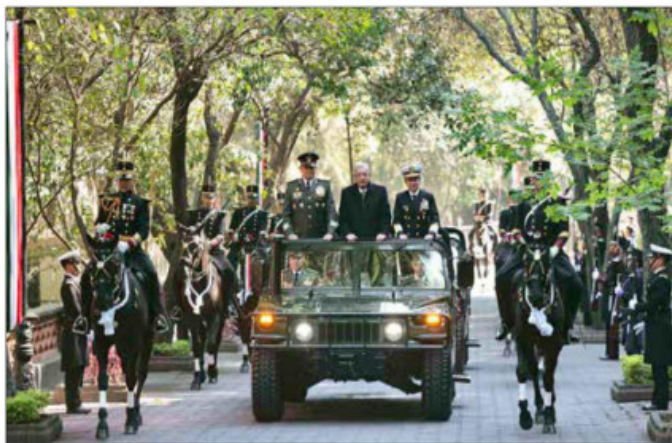
▲ López Obrador encabezó ayer el 111 aniversario de la Marcha de la Lealtad, en el Castillo de Chapultepec. Lo flanquean Luis Crescencio Sandoval, secretario de la

● Sheinbaum es perseverante, “como ya saben quién”; inflaron a Gálvez, pero no levantará, asevera en ¡Gracias!