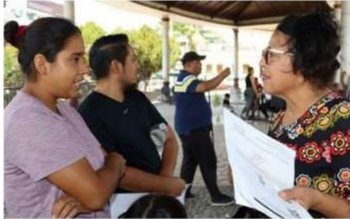
Mujeres migrantes hacen fila para tramitar sus papeles migratorios en una plaza del municipio de Tapachula, Chiapas. Más de la mitad de las mujeres migrantes en México citan las agresiones y las amenazas directas como la mayor razón por la que dejaron sus países.

Más de la mitad de las mujeres migrantes en México citan las agresiones y las amenazas directas como la mayor razón por la que dejaron sus países, por lo que la violencia doméstica es también motivo de su éxodo, según la Agencia de las Naciones Unidas para los Refugiados (Acnur).