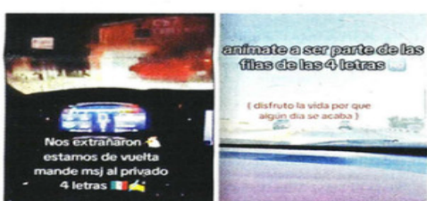
El CJNG lidera el uso de TikTok como canal de reclutamiento y propaganda, usando hashtags como #4letras.