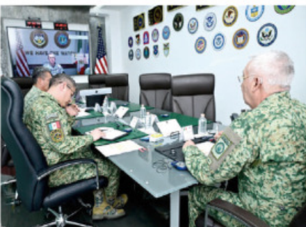
RICARDO Trevilla sostiene videollamada con el comandante del Comando Norte de EU.

SOSTIENEN llamada en la que se destacaron resultados; entre ellos, reducción de cruces ilegales a EU e incautación de fentanilo. pág. 6