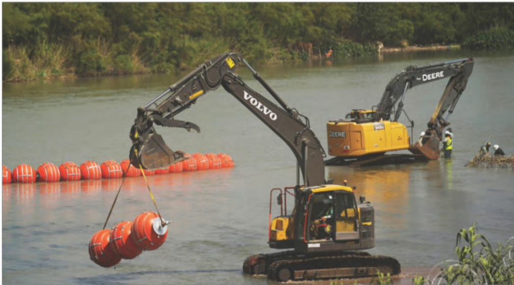
▲ La idea es continuar con la medida sin precedente impuesta por el gobernador republicano de Texas, Greg Abbott, quien