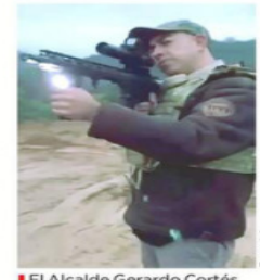
El Alcalde Gerardo Cortés fue reelecto en 2024.

El operativo, que inició en la madrugada de ayer, se centró en la localización del Edil (reelecto en 2024), quien fue buscado en su domicilio particular, negocios familiares y una propiedad conocida como "Casa de Piedra", donde, trascendió, residen trabajadores del Ayuntamiento. No obstante, los uniformados no lograron dar con el Municipio, por lo que ya