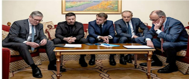
Los líderes de Gran Bretaña, Francia, Polonia y Alemania se reunieron ayer en Kiev con Volodymyr Zelensky y amagaron con sanciones a Rusia.

El Secretario del Tesoro estadounidense, Scott Bessent, y el Viceprimer Ministro chino, He Lifeng, lideran las negociaciones, que se espera que continúen hoy, en el primer diálogo directo desde que Trump impuso gravámenes del 145 por ciento a los productos chinos, y Beijing tomó represalias con tarifas del 125 por ciento.