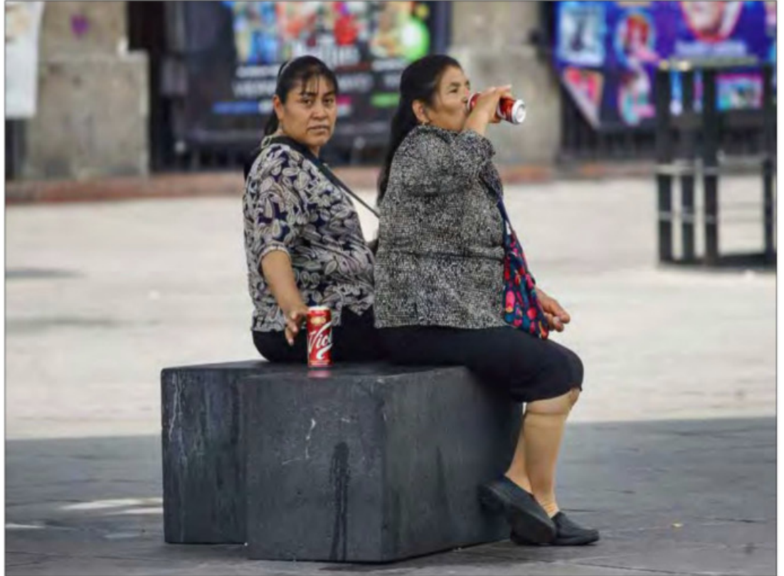
▲ Una pausa con chelas en calles del Centro Histórico.