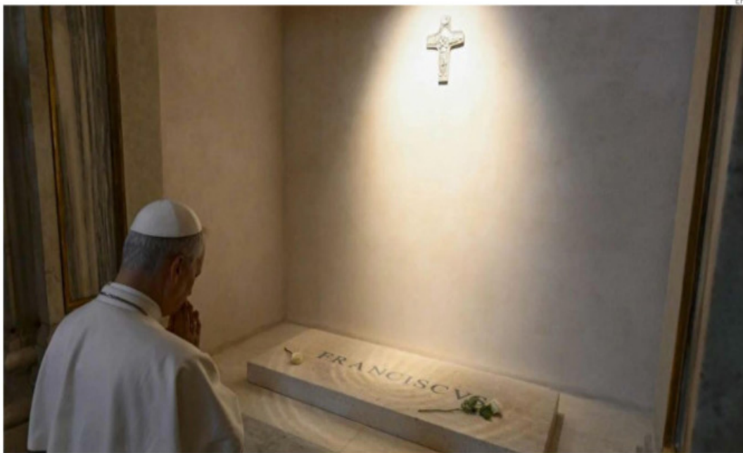
El papa León XIV acudió este sábado a rezar ante la tumba de Francisco. PAG. 18

El investigador de origen sueco Svante Pääbo, llegó a esa conclusión tras varios estudios; por este aporte recibió el Premio Nobel de Medicina y Fisiología en 2022. PAG. 16