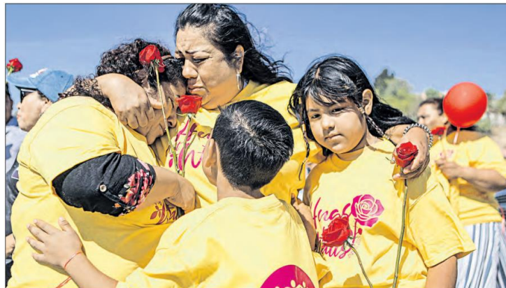
En el contexto del Día de las Madres, madres e hijos migrantes separados por las políticas de Estados Unidos se manifestaron ayer en Ciudad Juárez contra la militarización de la frontera

Madres migrantes, hijas e hijos separados por las políticas de Estados Unidos se manifestaron en los límites de México y ese país contra la militarización del lado estadounidense, donde se creó una nueva zona castrense a la orilla del río Bravo.