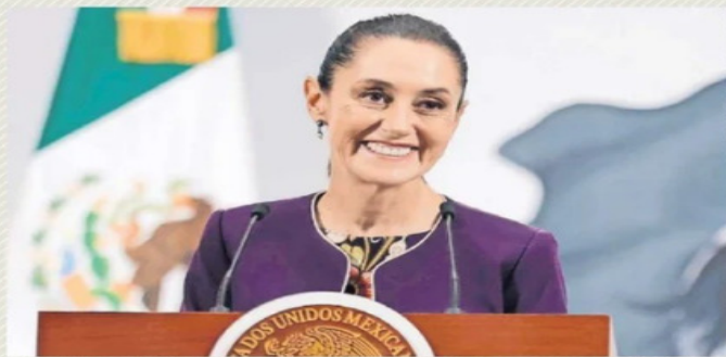
La presidenta Claudia Sheinbaum destacó en su conferencia mañanera que la estrategia de cabeza fría, temple y defensa con firmeza de los principios ha funcionado.