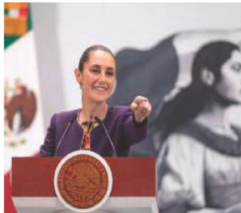
LA PRESIDENTA, ayer, en Palacio, tras la llamada con Trump.

Fue conversación fructífera: magnate; recalca que siguen algunas tarifas; su vocera admite aumento en cooperación: México acepta remover barreras comerciales no arancelarias págs. 3 y 4