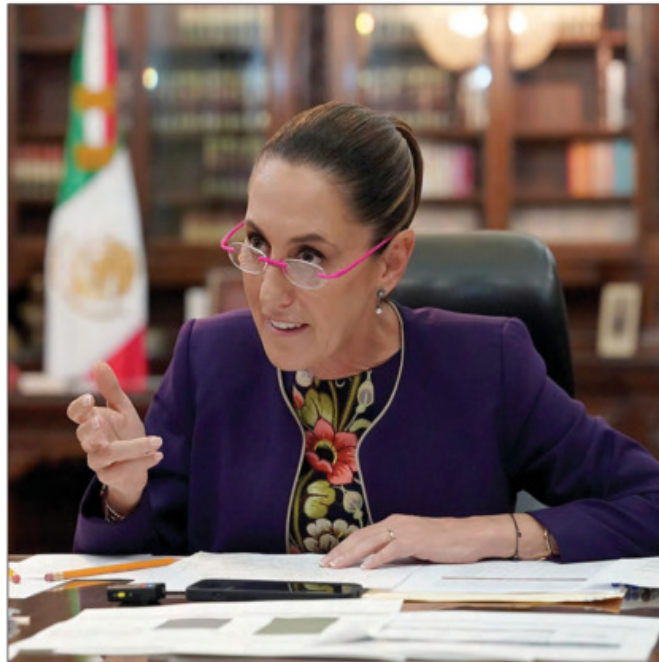
▲ Luego de la llamada telefónica de 40 minutos de duración con el mandatario estadounidense, la presidenta Claudia Sheinbaum acudió a la mañana

● Conseguimos trato superior respecto a cualquier otro país; es “oro molido”: Ebrard