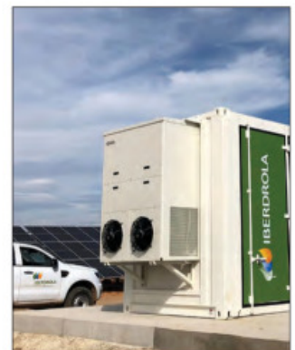
▲ La española Cox anunció ayer la compra de lo que resta de los negocios en México de la firma energética en una operación valorada en 4 mil 200 mdd. Foto La Jornada A. TEJEDA, CORRESPONSAL / P 19