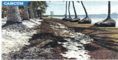
CANCÚN MAR DE SARGAZO. El principal destino turístico del estado ha visto disminuir el número de turistas.

de 2025, respecto del mismo periodo del año previo. La caída en el Aeropuerto de Cancún fue de 4.7 por ciento. Especialistas de la UNAM advirtieron desde mediados de junio que la masa de sargazo que se estaba formando en el trópico alcanzaba ya entre 37.5 y 40 millones de toneladas, casi el doble del récord registrado en 2018, cuando los satélites detectaron aproximadamente de 20 a 22 millones de toneladas.