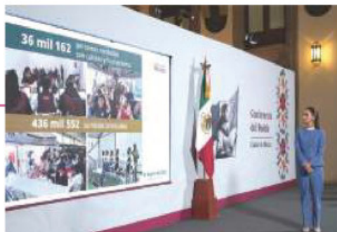
LA PRESIDENTA durante su conferencia mañanera, ayer.

MÉXICO ganó con tregua de aranceles, afirma; en EU caen bolsas tras proclama de Trump por gravamen a países. págs. 6 y 9