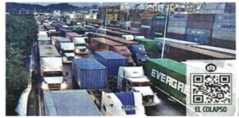
Kilométricas filas de camiones se observan en los accesos al puerto de Manzanillo.

de alerta alto (rojo) en su semáforo de presencia de sargazo en la Zona Económica Exclusiva (ZEE) del Caribe mexicano durante 23 de los 31 días de julio. En su boletín diario sobre el sargazo, el Instituto Oceanográfico del Golfo y Mar Caribe de la dependencia estimó que el pico de la presencia de la macroalga tuvo lugar el 9 de julio, con 31 mil 186 toneladas distribuidas en 41.9 por ciento de la ZEE.