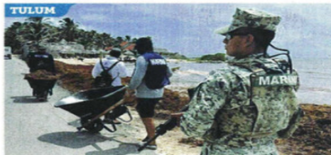
TULUM SIN PALA PERO CON RIFLE. La Marina se ha multiplicado en labores de limpieza y de seguridad.