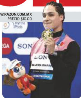
EL MEXICANO, ayer, con su medalla.