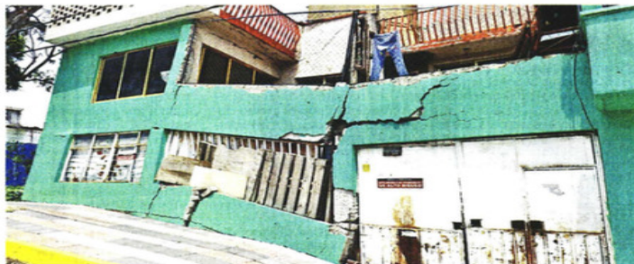
Una de las casas afectadas por las grietas en Zona Urbana Ejidal Santa Martha Acatitla.

Una de las apuestas de los especialistas es el desarrollo del sistema Cajas Disipadoras de Deformaciones,