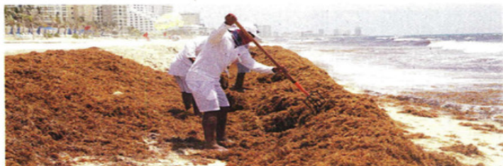
La llegada masiva de sargazo a las costas de Quintana Roo ha ahuyentado al turismo.

La lista de naciones afectadas será publicada en próximos días.