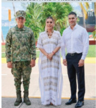
LA GOBERNADORA de Guerrero con los titulares de Marina y SSP, ayer.