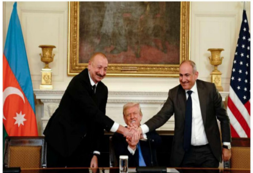
Líderes de Armenia y Azerbaiyán harán una nominación conjunta al Comité Nobel para proponer al presidente de EU, Donald Trump, al Premio Nobel de la Paz por la mediación del republicano que culminó en un acuerdo de paz entre ambas naciones en conflicto.

firmado una orden secreta instruyendo al Pentágono a utilizar la fuerza militar contra los cárteles del narcotráfico en América Latina. En las últimas semanas, el mandatario republicano ha vuelto a señalar abiertamente la amenaza de los cárteles mexi-