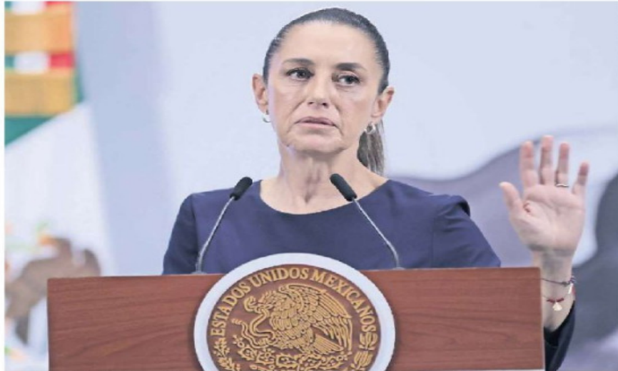
La presidenta Claudia Sheinbaum destacó que cuando se ha planteado por parte del gobierno de Donald Trump que haya participación de militares estadounidenses en territorio mexicano siempre se ha rechazado.

En Palacio Nacional, subrayó que su gobierno colabora y coopera con el de Estados Unidos, pero recaló que está descartado que vaya a haber alguna invasión militar estadounidense en México.