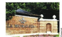
El barrio La Moraleja es de los más exclusivos de Madrid.

que a raíz de la falta de respuestas a la carta de López Obrador, Sheinbaum no invitó al Rey Felipe VI a su toma de protesta. Arturo Pérez-Reverte, escritor y miembro de la Real Academia de la Lengua Española, ironizó: "Violentando su honrada conciencia indigenista, imaginó. Y la de su no menos honrado esposo".