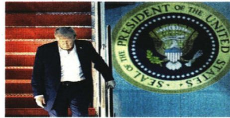
El Presidente Trump desembarcó la madrugada de ayer del Air Force One en la Base Conjunta Andrews, en Maryland, tras su encuentro con Putin en Anchorage, Alaska.

A cambio, Putin ofreció aceptar una tregua en las líneas de batalla actuales, así como una promesa escrita