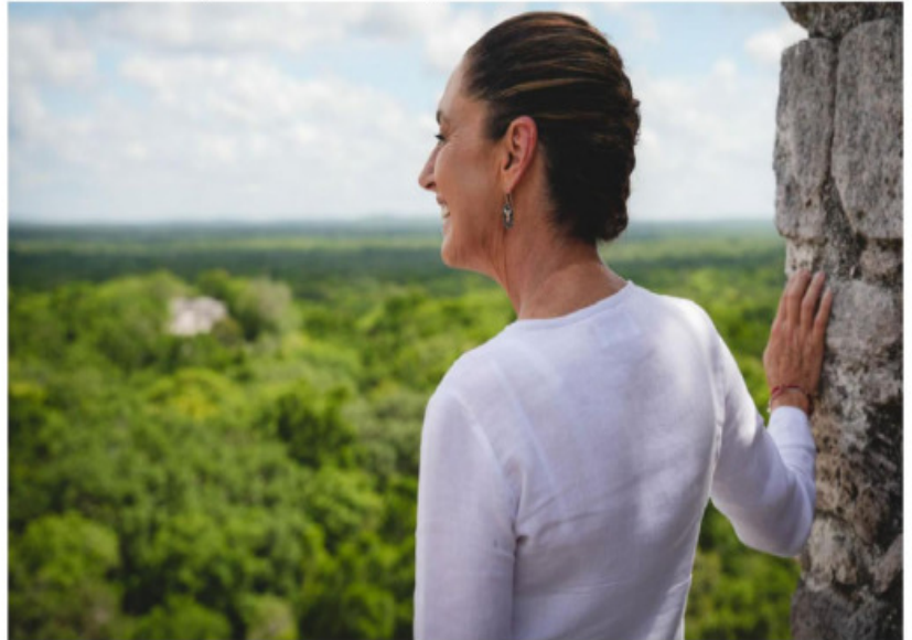
"Esta mañana tuvimos tiempo de observar la extraordinaria belleza de Calakmul, en lo que ahora es el Corredor Biocultural Gran Selva Maya. México es grandioso", subrayó la presidenta Claudia Sheinbaum durante su visita a Campeche, donde también inauguró el Centro Libre para Las mujeres. PAG. 5