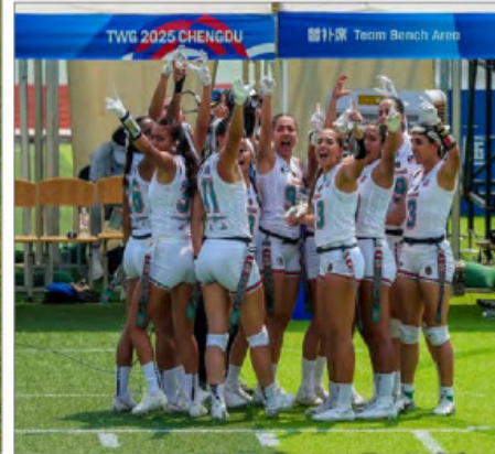
Junior de Asunción, Paraguay. El equipo femenino de Tochito Bandera retuvo el título en los Juegos Mundiales de Chengdú, China. JESÚS ESTRADA, CORRESPONSAL, Y REDACCIÓN / P 27 Y DEPORTES