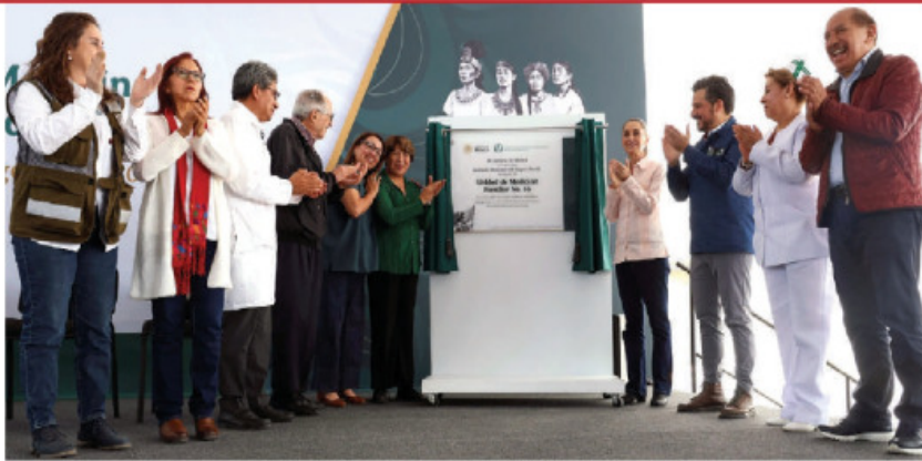
CLAUDIA Sheinbaum y la gobernadora Delfina Gómez, ayer.

LA PRESIDENTA entrega unidad médica en Ecatepec; cifra de pobres, la más baja en 40 años; a algunos les es imposible reconocerlo, advierte. pág. 10