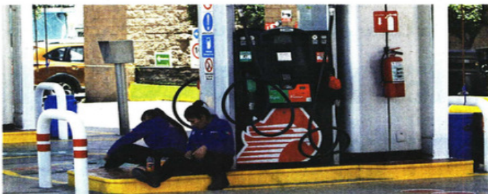
Los gasolineros alertaron sobre las fallas logísticas de Pemex que han generado desabasto.

En el mismo llamado de atención a las autoridades, pidieron a la Presidenta Claudia Sheinbaum que se abra