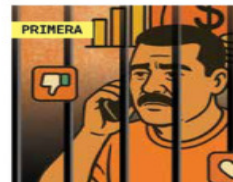
Ilustración: Erick Retana

Reos aprovechan el desarrollo de la tecnología y las redes sociales para defraudar desde la cárcel, ahora a través de compras en línea. / 21