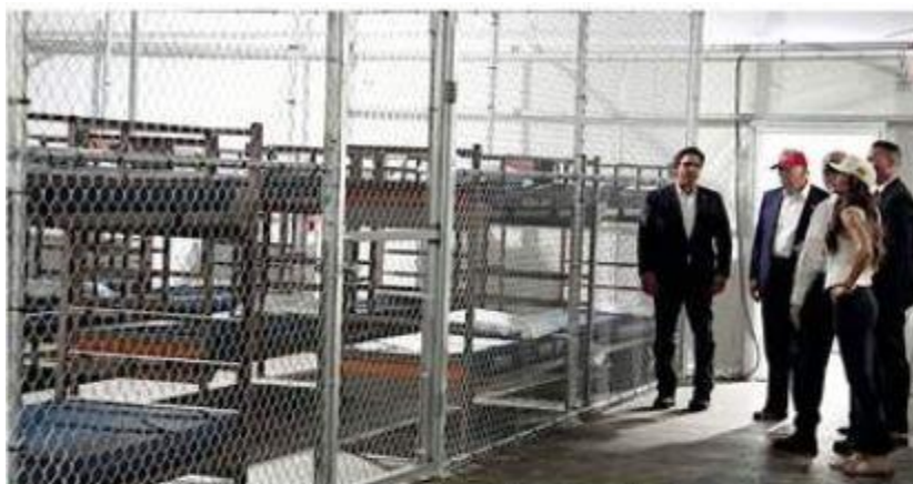
El Presidente Donald Trump recorrió el centro de detención el día de su apertura el 2 de julio.