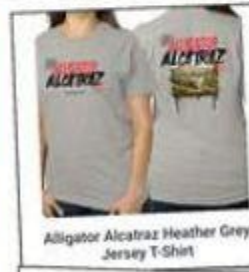
Alligator Alcatraz Heather Grey Jersey T-Shirt