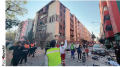
ASPECTO de los inmuebles afectados, ayer.