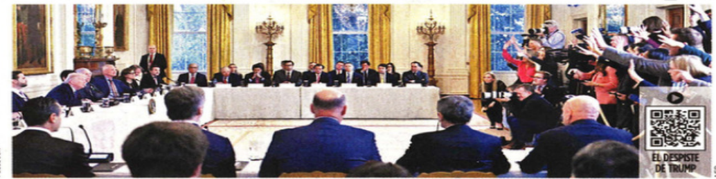
Trump hizo público el arranque del encuentro con petroleros en la Casa Blanca; luego continuó la reunión en privado.

Dan empresarios tibia recepción a plan de invertir 100 mil mdd