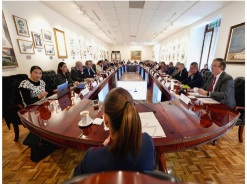
La presidenta Claudia Sheinbaum durante su reunión con economistas en Palacio Nacional.

Destacó la importancia de mantener un diálogo técnico en momentos clave para la relación económica regional, previo a la revisión del T-MEC