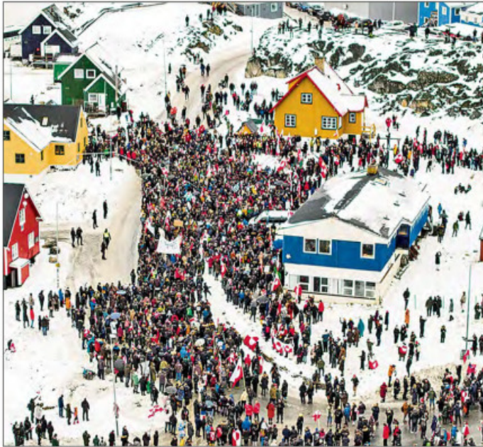
▲ Miles de manifestantes con banderas de Groenlandia y Dinamarca protestaron en Nuuk (en la imagen) y Copenhague contra las ambiciones imperialistas de Estados Unidos. Trump anunció un

Subirán más si no hay acuerdo de “compra total” de la isla, emplaza