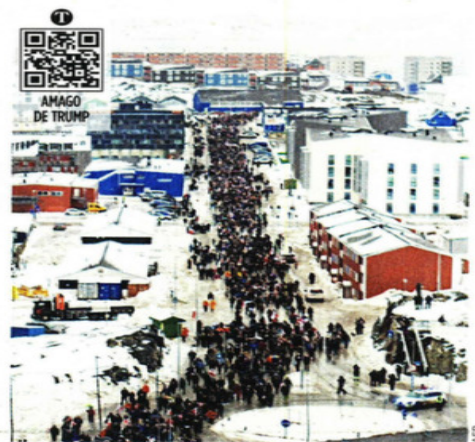
Miles de personas marcharon en Nuuk, la capital groenlandesa, con carteles de protesta contra Trump y coreando: "Groenlandia no está en venta".

Además, se han dado reformas que prohíben el outsourcing, al sistema de pensiones y al Infonavit, y está la promesa de la reducción gradual de la jornada laboral de 48 a 40 horas a la semana.