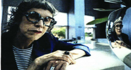
CAROL PINO / EL UNIVERSAL