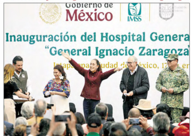
▲ La presidenta Claudia Sheinbaum inauguró el Hospital General Ignacio Zaragoza del IMSS, que sustituye a la clínica 25, demolida tras el sismo de 2017. ALMA E. MUÑOZ / P 3