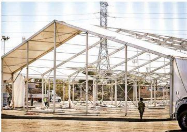
En algunas ciudades se levantaron albergues gigantes para recibir a repatriados.

MIL 537 REPATRIACIONES de connacionales hubo de enero a diciembre de 2025.