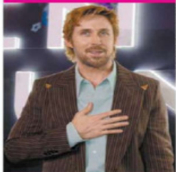
FUERO SUICOR EL UNIVERSAL