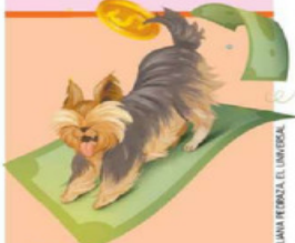
LIJANA PERAZA EL UNIVERSAL