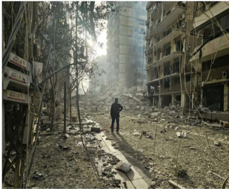
Imagen de la devastación causada por un bombardeo nocturno de Israel sobre suburbios del sur de Beirut, en Líbano