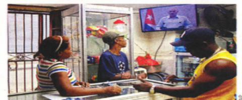
■ Ciudadanos de La Habana observan en la televisión el mensaje del Presidente Miguel Díaz-Canel.