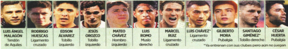
*Ya entrenan con sus clubes pero aún no juegan

SÁBADO 14 / MARZO / 2026 CIUDAD DE MÉXICO 50 PÁGINAS, AÑO XXXIII NÚMERO 11,754 $ 30.00