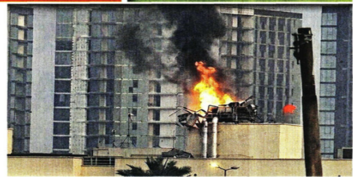
Una estructura en el techo de la Embajada en Bagdad quedó en llamas.