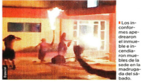
Los inconformes apedrearon el inmueble e incendiaron muebles de la sede en la madrugada del sábado.

El Presidente Miguel Díaz-Canel reconoció el "malestar" social, pero denunció actos vandálicos en las protestas.