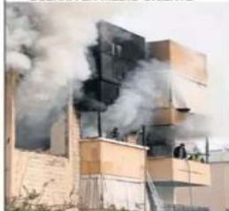
MONSIEUR ZARTRE, AP

EU pide a aliados que envíen buques a Ormuz