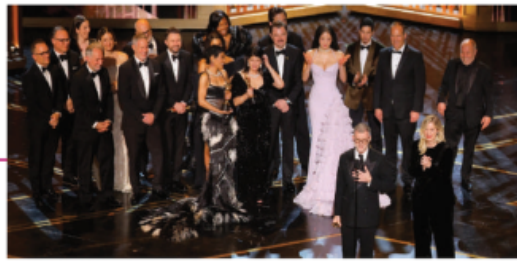
EL DIRECTOR, al recibir el Oscar a Mejor Película, ayer.

LA PELÍCULA de Paul Thomas Anderson se lleva seis premios Oscar; la cinta de Ryan Coogler sólo cuatro, pese a sus 16 nominaciones; Frankenstein , del mexicano Guillermo del Toro, tres estatuillas. págs. 24 y 25