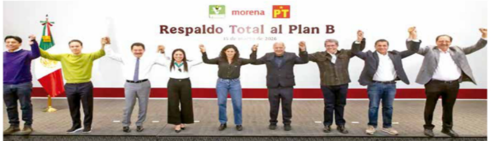
Dirigentes y coordinadores legislativos de Morena, Partido Verde y del Trabajo emitieron un mensaje grabado en la Secretaría de Gobernación.

— Con información de Lourdes López, Anacely Garza, Flor Castillo y Andrés Guardiola PRIMERA | PÁGINAS 16 Y 17 DINERO