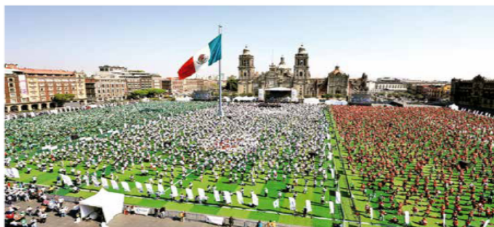
ROMPEN RÉCORD GUINNESS