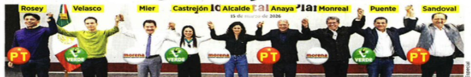
Dirigentes de partidos grabaron en el Salón Revolución de la Segob el video de respaldo al plan B de la reforma electoral.

'Olvidan' recorte de 1,800 mdp para los partidos y el ajuste de pluris