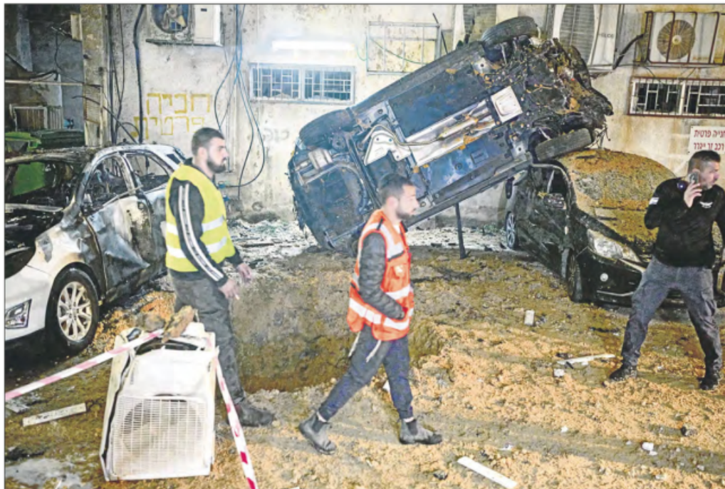
▲ El presidente Donald Trump declaró que la respuesta de Irán fue "la mayor sorpresa que me ha dejado este asunto". Teherán informó que lanzó misiles de gran alcance contra