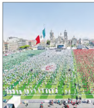
▲ Las actividades rumbo a la inauguración del Mundial dieron inicio con 9 mil 500 personas en la cancha instalada en el Zócalo. JUAN MANUEL VÁZQUEZ / DEPORTES