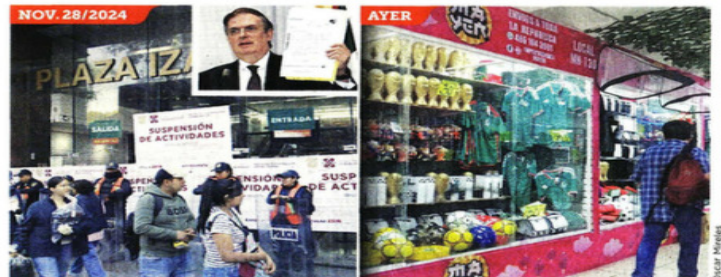
El Gobierno clausuró en noviembre de 2024 la plaza de Izazaga 89, y el Secretario Ebrard prometió la extinción de dominio, pero el lugar fue reabierto y sigue la venta de "piratería".

Durante su campaña, Trump dijo que aplicaría aranceles de hasta el 60 por ciento a productos de China y días antes del operativo en la CDMX anunció un impuesto adicional del 10 por ciento, en el inicio de una guerra comercial que amenazó con extender a países como México que consideraba puerta de entrada para esas mercancías asiáticas.