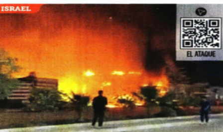
Irán atacó ayer las ciudades sureñas de Dimona y Arad, cercanas al principal centro de investigación nuclear de Israel.