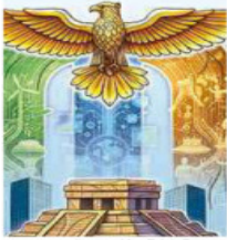
Ilustración: Erick Retana