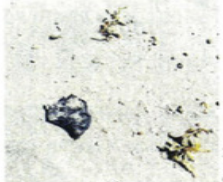
Manchas de chapopote encontradas por turistas en la Isla del Padre.

Aunque hasta anoche la Oficina General de Tierras