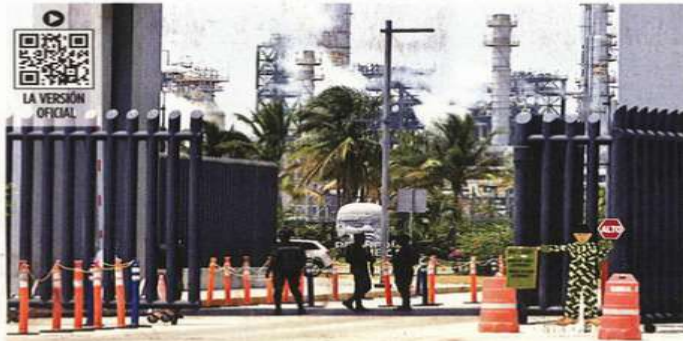
Aspecto de la refinería de Dos Bocas ayer, que, según Pemex, operaba con normalidad.