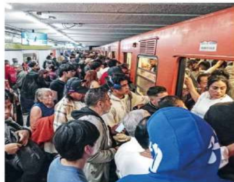
La Línea 3 fue una de las más afectadas con el paro escalonado, debido a que sólo operaron 20 de 35 trenes, indicó el sindicato del Metro.

de la Secretaría de Infraestructura, Comunicaciones y Transportes, y sus dependencias vinculadas.