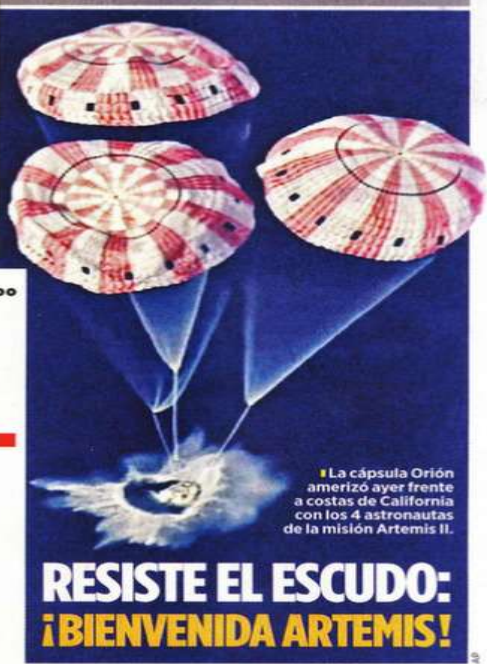
La cápsula Orion amerizó ayer frente a costas de California con los 4 astronautas de la misión Artemis II.