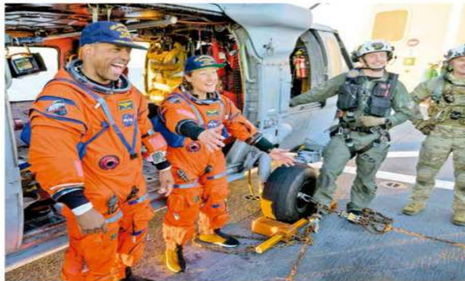
El capitán Victor Glover y la astronauta Christina Koch, luego del amerizaje en las costas de California.