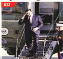
Los negociadores (el Vicepresidente JD Vance y el líder del Parlamento iraní) se alistaban para un encuentro en Pakistán.

La delegación iraní, encabezada por el presidente del Parlamento iraní, Mohammad Basqat Qalibaf, y el ministro de Asuntos Exteriores, Abbas Araghchi, llegó ayer