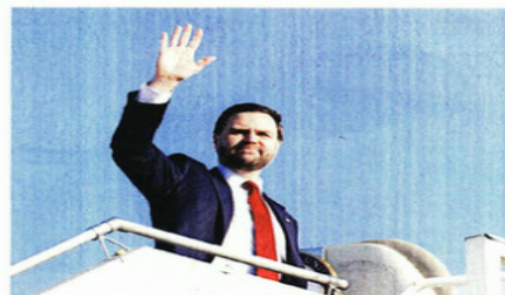
SEVA. El Vicepresidente de EU, JD Vance, saluda al abordar el Air Force Two para dejar Pakistán, tras participar en las conversaciones con Irán en Islamabad.

La refinería de Ciudad Madero, en Tamaulipas, tuvo su último incidente grave hace 9 años: una emanación de ácido sulfúrico dejó un muerto y 3 intoxicados, mientras que en la planta de Salamanca, Guanajuato, se registró un incendio en el año 2024, pero no provocó víctimas.