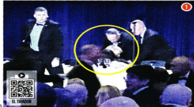
TERROR EN LA CENA Agentes del Servicio Secreto protegieron anoche al Presidente Donald Trump (1) en la cena de corresponsales de la Casa Blanca tras escucharse disparos. Otros elementos (2) se movilizaron en el hotel Washington Hilton, donde se realizaba el evento. Un hombre de 31 años (3), residente de California, fue detenido por la agresión.

2023 LICITACIÓN ORDINARIA ■ Adultos Mayores y Personas con Discapacidad, hasta 484 mdp