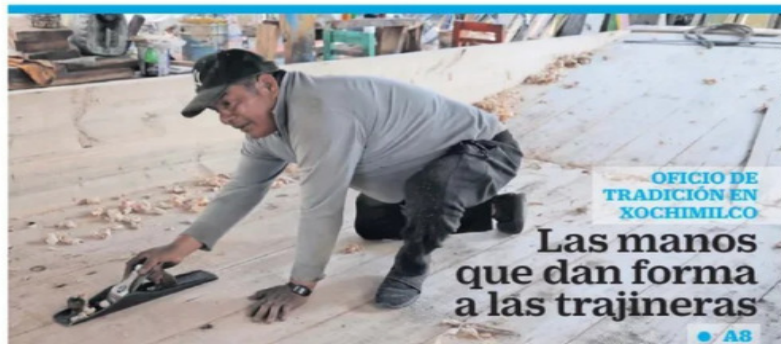
OFICIO DE TRADICIÓN EN XOCHIMILCO

Sheinbaum dijo que el lunes se informará sobre el ingreso de agentes de EU que participaron en el operativo en Chihuahua.