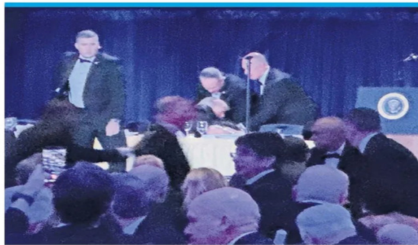
CAOS EN LA CENA DE CORRESPONSALES