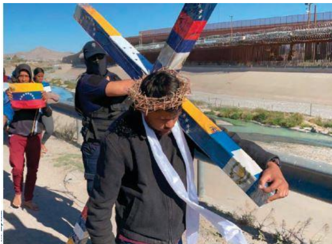
PERSONAS de diferentes países cargan una cruz en Ciudad Juárez, Chihuahua, ayer.