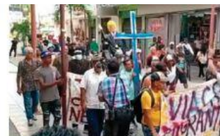
PROCESIÓN en Tapachula, Chiapas, previo al Viernes Santo.