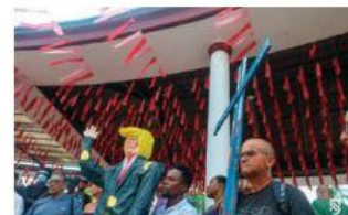
PROTESTA contra políticas de Donald Trump, ayer, en Tapachula, Chiapas.

Mientras millones de mexicanos participan en procesiones, misas y rituales de Semana Santa, para los migrantes que transitan o residen aquí estas fechas representan mucho más que tradición: un espacio de identidad, esperanza y resiliencia frente a la incertidumbre y los desafíos que enfrentan en su viaje.