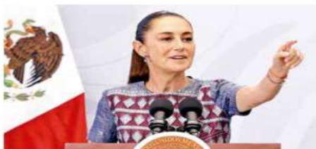
SHEINBAUM DESTACA MEJORAS