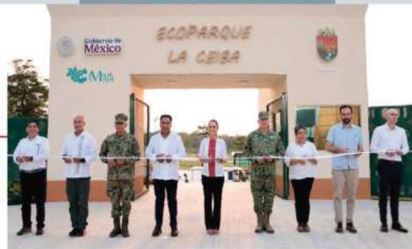
LA MANDATARIA inaugura el Ecoparque La Ceiba en Palenque, Chiapas, ayer.

LÍDERES sindicales reconocen avances laborales, pero demandan una reforma fiscal para que agualdo y horas extra exenten impuestos. págs. 4 y 6