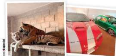
ANIMALES exóticos y autos decomisados, ayer.

EU da por "terminadas" las hostilidades con Irán, con sus fuerzas aun apuntadas contra ese país; la guerra aún no se da por concluida. págs. 12 y 13